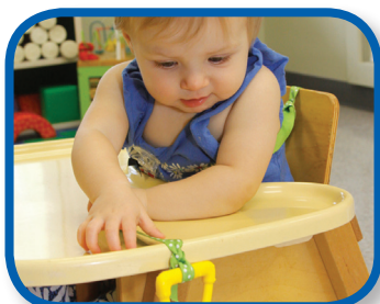
Recupera la sonaja De 6 a 12 meses