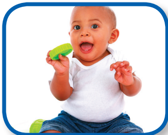
Haciendo ruidos De 3 a 6 meses