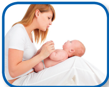
Begin with a Whisper 0-6 months