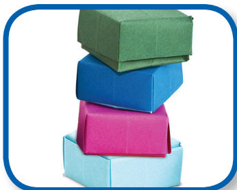
Ármela otra vez De 3 a 6 meses